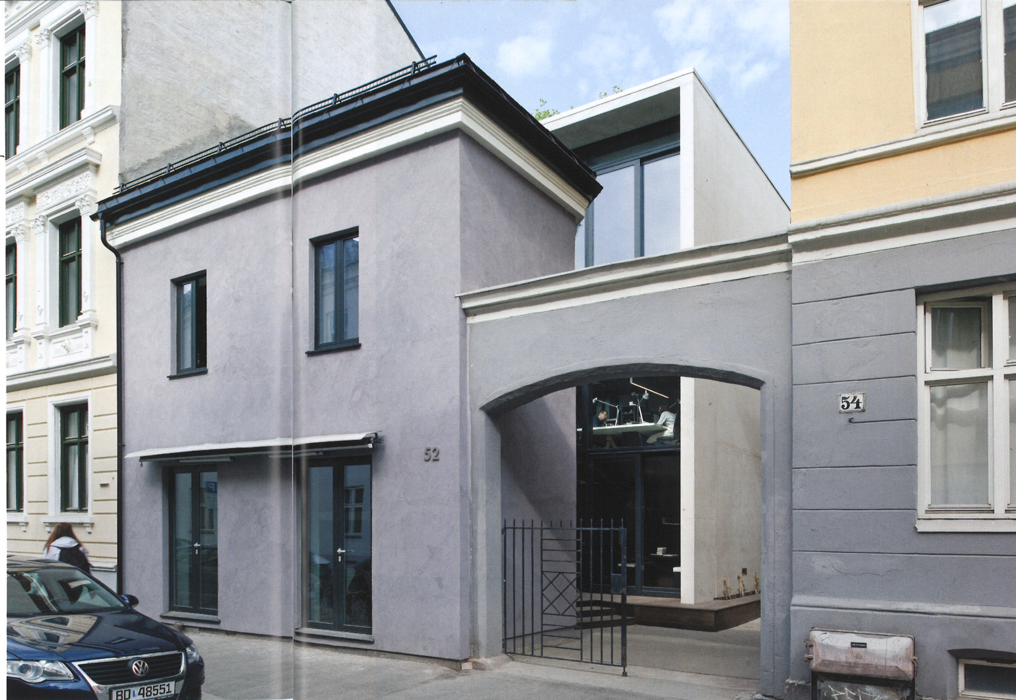
Sett fra Industrigaten

Tekst: Henriette Salvesen, div.A arkitekter